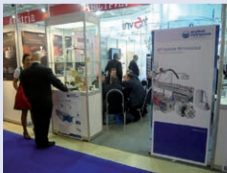
„technology by innovation“ auf der Interplastica 2010 in Moskau